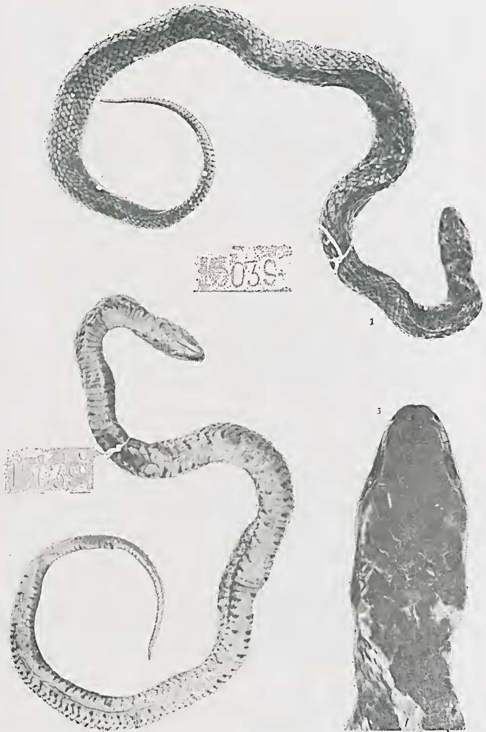
Fig. 1 a 3 — Dromicus poecilogyrus lancinii ; 1 - Vista dorsal, 2 - Vista ventral, 3 - Detalhe da cabeça.